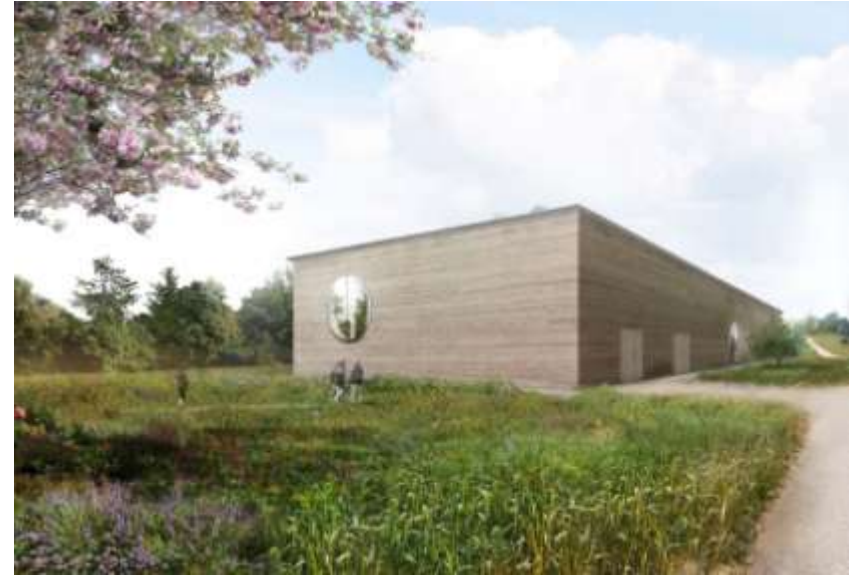
Herzog & De meuron Ricola Herb Centre (Laufen - suisse)