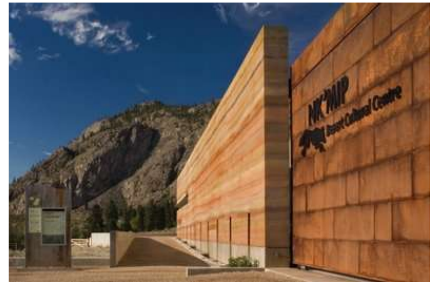
Nk-Mip Desert Cultural Centre - HBBH Architects