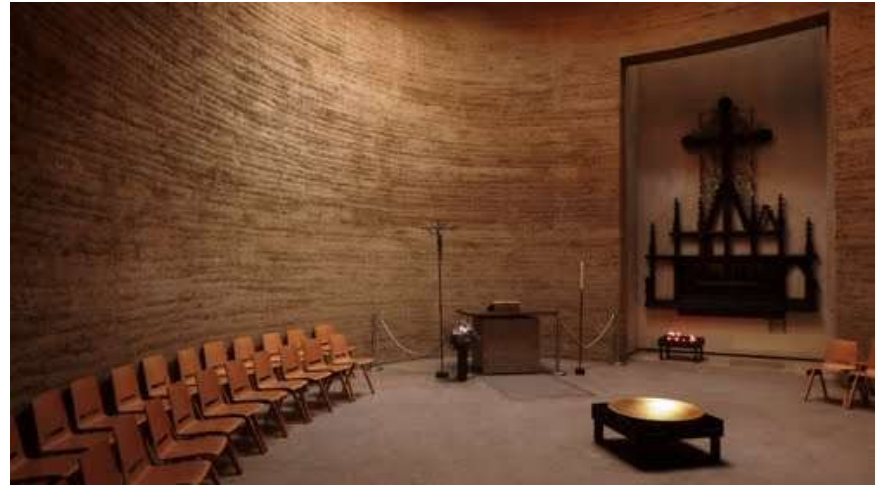
Chapelle de la réconciliation à Berlin