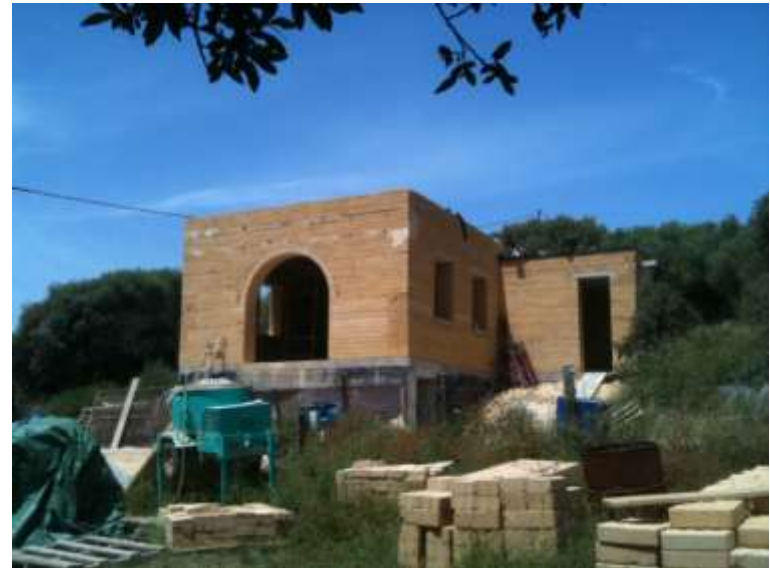
Laboratoire pour huiles essentielles, P.Casalonga, STUDIE