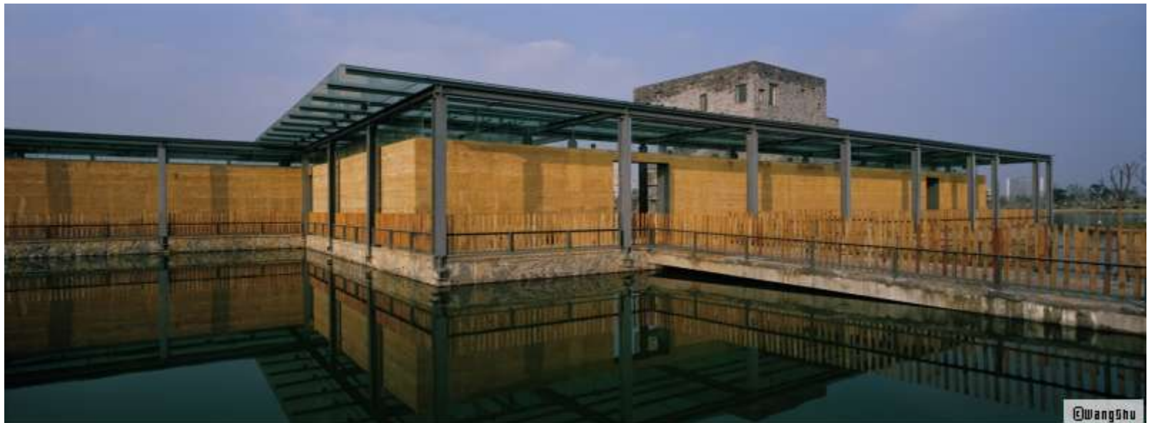
Tea House, Wang Shu et Lu Wenyu architectes, Hangzhou, Chine Photo : Wang Shu