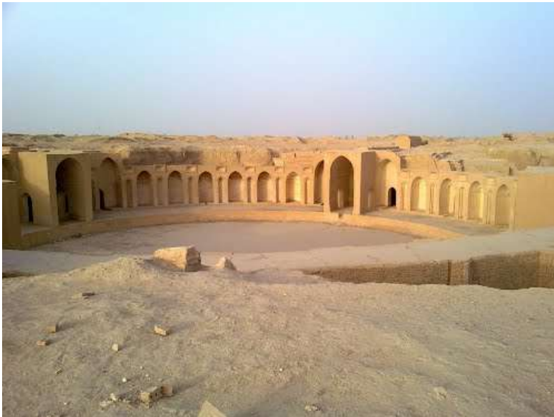
Samarra en Iraq (VI - IX siècle)