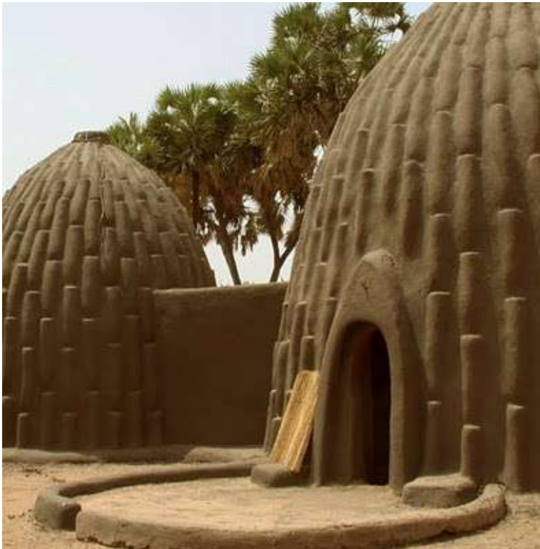
Maison Musgum au Cameroun