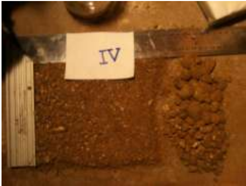
La terre est composée de grains de différentes tailles