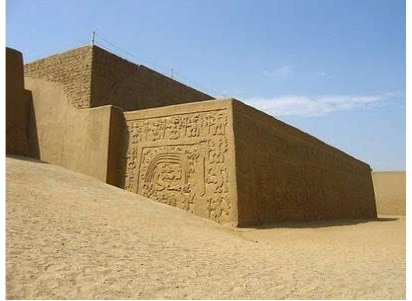
Chan Chan au Pérou (850 à 1470)