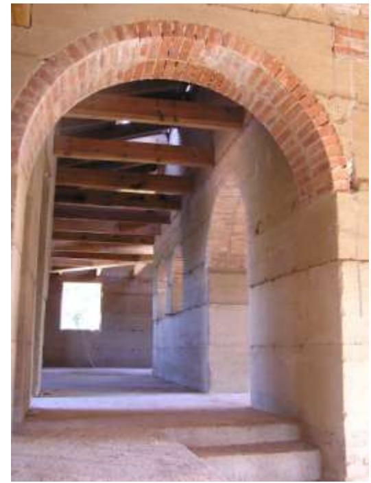
Maison à Sartène (2A), P. Casalunga + STUDIE