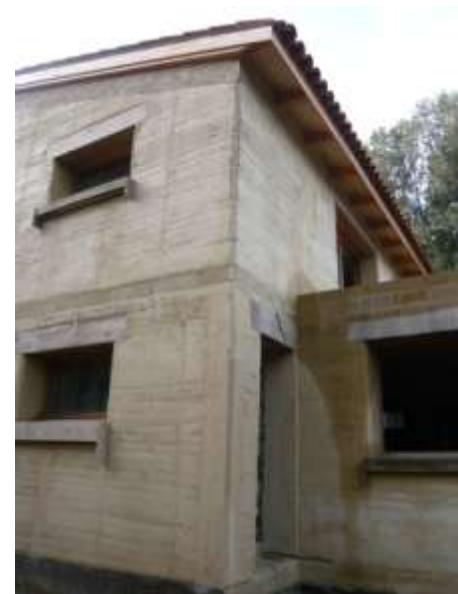
Maison à Cervione (2B), P. Casalunga + STUDIE