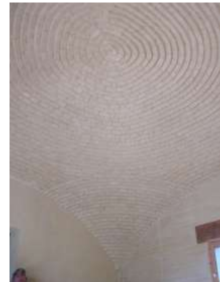
Maison individuelle à Calvi (2B), P. Casalonga + STUDIE