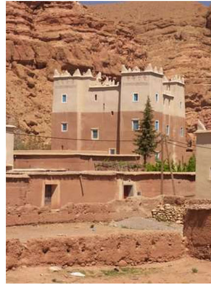
Vallée de Roses au Maroc