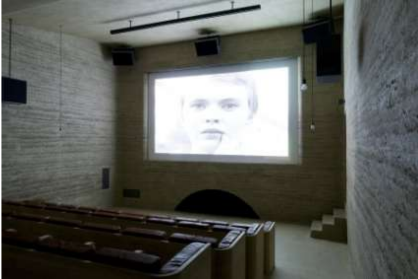
Cinema Sil Plaz Suisse Capaul & Blumenthal Architects