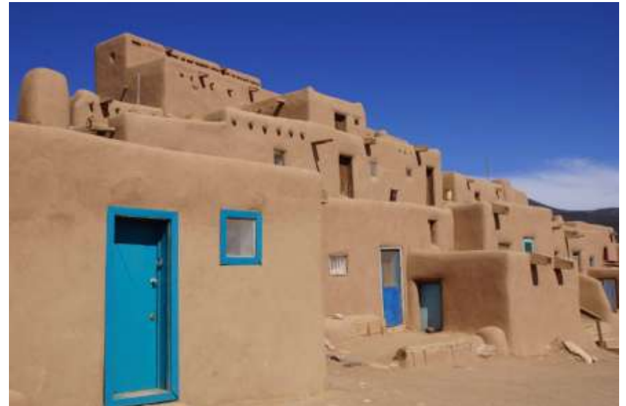
Pueblo de Taos Rio Grande USA (XI - XV siècle)