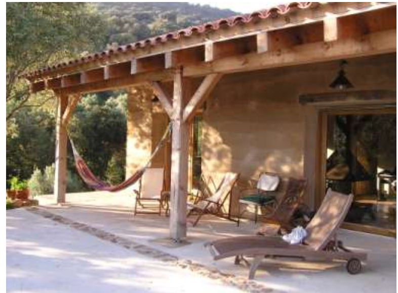
Maison à Olmeto (2A), P. Casalunga + STUDIE