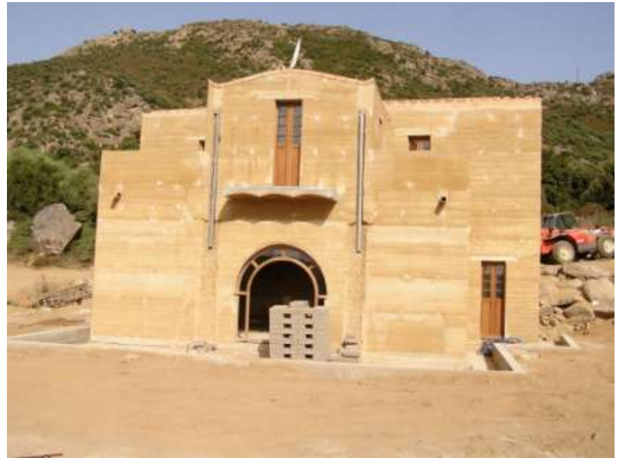
Maison à Belgodere (2B), P. Casalunga + STUDIE