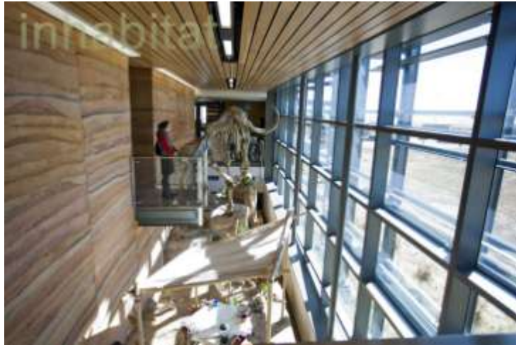
Southeast Wyoming Welcom center USA