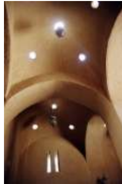
Village de Gourma en Egypte Architecte : H. Fathy