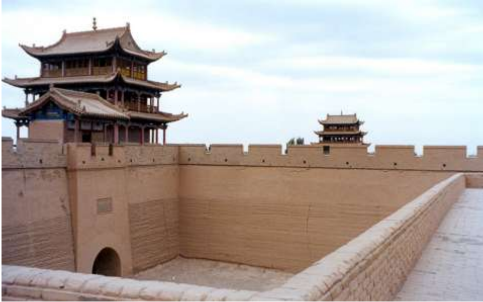
La grande muraille de Chine (Jiayuguan 1372)