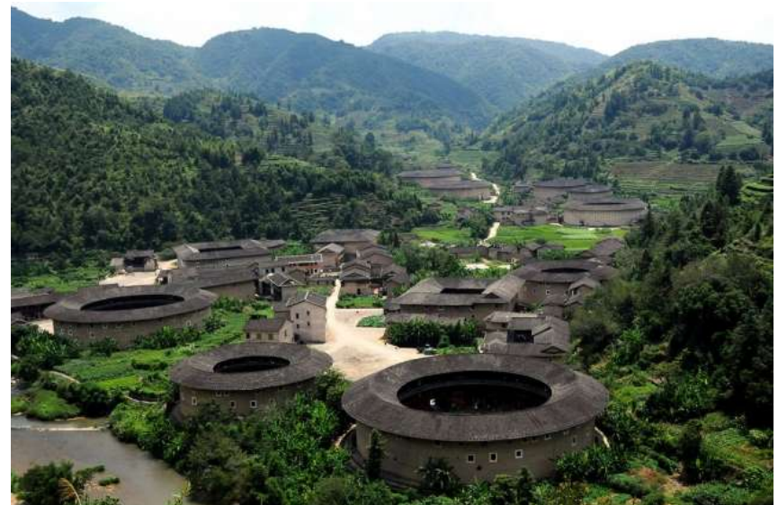
Tulou : Habitat traditionnel province du Fujian en Chine